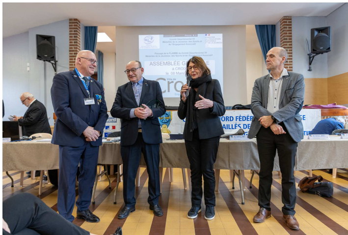
Passage de la « flamme » Marchiennes → Croix