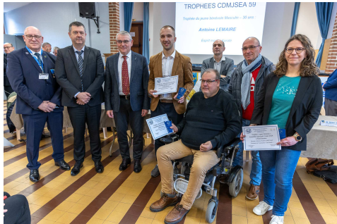
Remise des trophées et médailles